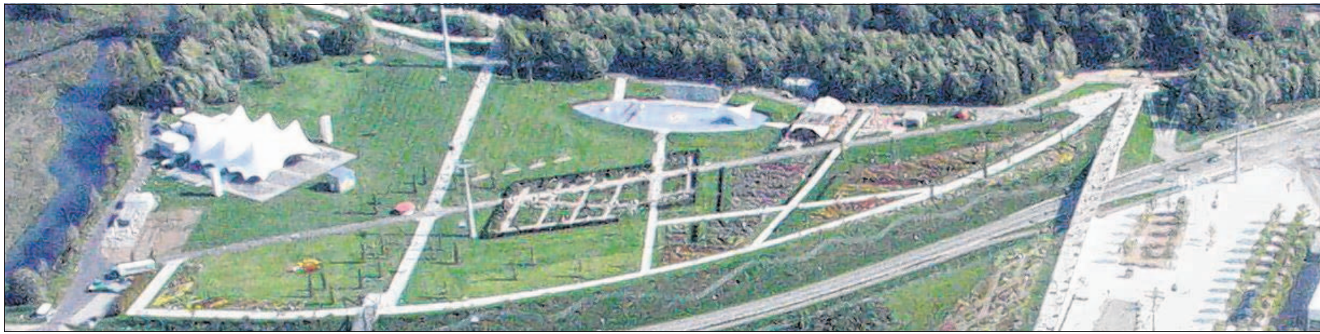
Viele Zehntausend Besucher passen in den IGA-Park. 41 000 Gäste ist bisheriger Rekord – am Abschlusstag der Gartenbauausstellung am 12. Oktober 2003.