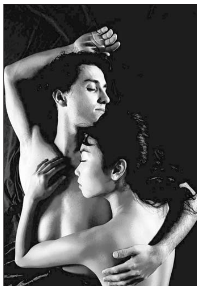
Mit diesem Plakat wirbt das Theater für die Ballett-Premiere.